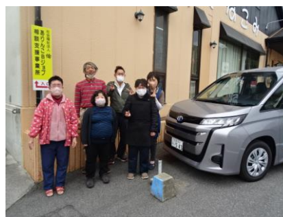
利用者様と一緒に 送迎や外出など活用していきます