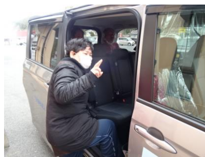
送迎車に乗る様子 新しい車で広く快適です