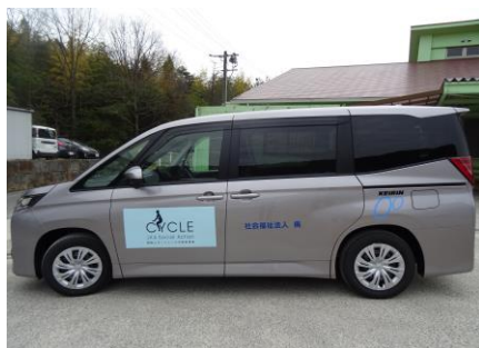
車両の外観 すぐに送迎車と分かります

移送車4の購入 ( http://www.rin-arinko.com/images/pdf/202303kanryo.pdf )